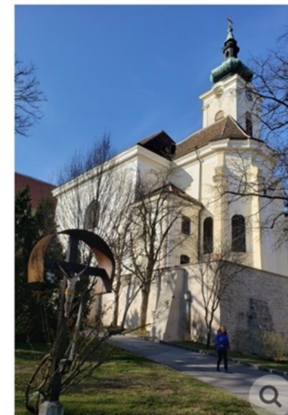
Die Ober St. Veiter Pfarrkirche am Wolfrathplatz wurde dem heiligen Vitus geweiht.

Und, wie oft wurde die Ober St. Veiter Kirche neu gebaut? 🏛️